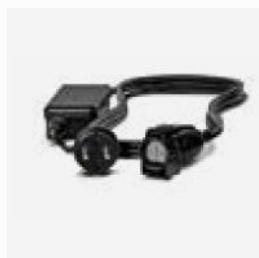
Cargador apto para su uso en exteriores