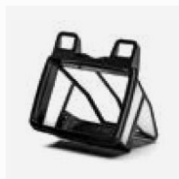
Bandeja de filtro Filtro 100µ